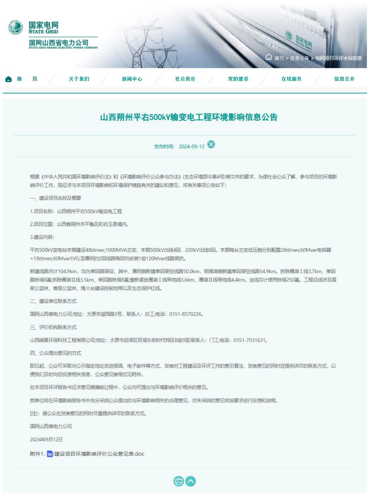
图1 首次环境影响评价信息公开网络公示截图