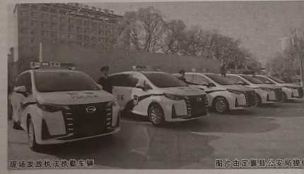
定襄县执法执勤车辆

此次投入使用的7辆全新执法执勤车辆,为基层一线提升执法效率,增强服务保障能力奠定了坚实基础,充分体现了县委、县政府和局党委对公安工作的支持和厚爱,也彰显了新一届局党委提升基层新战斗力、夯实基础建设的决心和信心,标志着定襄公安在现代化、正规化建设上又迈上了新台阶。